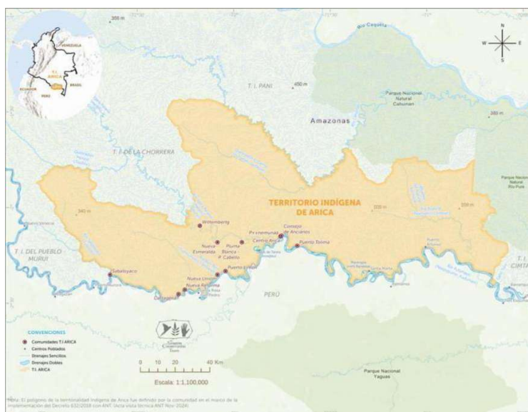
Mapa Territorio Indígena Arica— área de implementación del subacuerdo Sistemas Hídricos Vivos un modelo integrado para conservación

El Territorio Indígena de Arica tiene una extensión de 1.491.894 hectáreas aproximadamente, se encuentra dentro del área del resguardo indígena Predio Putumayo con una ocupación del 26% del área. Colinda al sur con la cuenca del Putumayo y comunidades nativas del Perú; al norte con el Territorio Indígena PANI (TI PANI) y el Parque Nacional Natural Cahuarí (PNNCH); al este con el Territorio Indígena del Bajo Río Caquetá-Amazonas (TI BRC), Parque Nacional Natural Río Puré (PNNRP) y la zona de reserva forestal Ley 2, y, al oeste con la Asociación Zonal Indígena de Cabildos y Autoridades Tradicionales Indígenas de La Chorrera (AZICATCH).