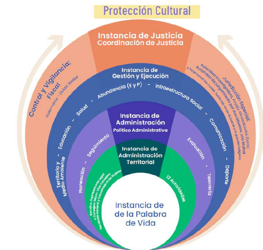
Diagrama de la estructura político – administrativa del Territorio Indígena Arica

El gobierno cuenta con la Instancia de Justicia, orientada por la coordinación de justicia y compuesta por áreas de jurisdicción especial y control y vigilancia. Su función es garantizar la armonía comunitaria mediante la prevención, los llamados de atención y la aplicación de los valores y principios culturales. De esta manera, el sistema de gobierno del Territorio Arica no solo regula el funcionamiento político y administrativo, sino que también preserva la espiritualidad, la cohesión social y el equilibrio con la naturaleza, asegurando que cada decisión responda a los mandatos ancestrales y a la protección integral del territorio.